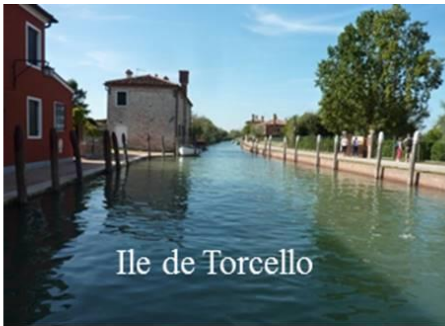
Ile de Torcello