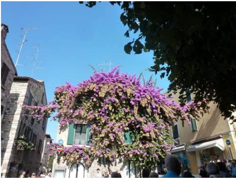
Villa de Maria CALLAS