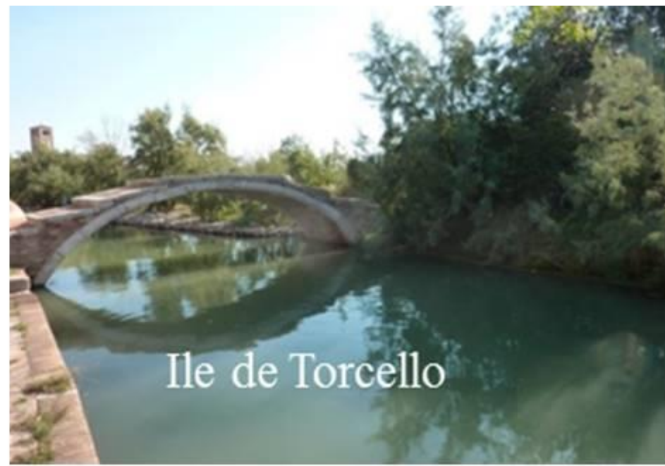
Ile de Torcello