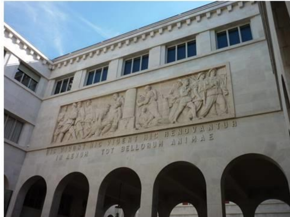
Maison historique de bâtiment de l'université de Padoue à partir de 1539, à Padoue