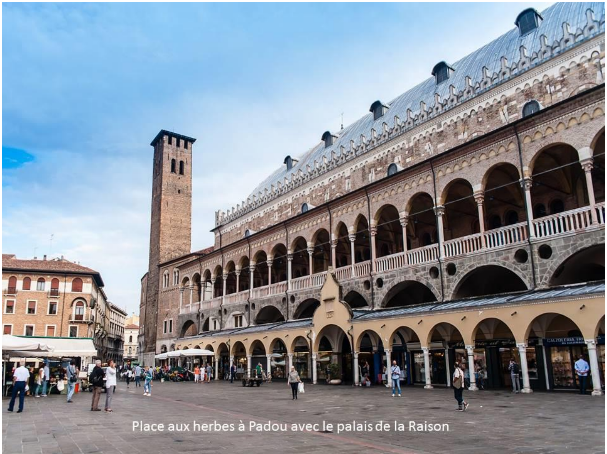
Place aux herbes à Padoue avec le palais de la Raison