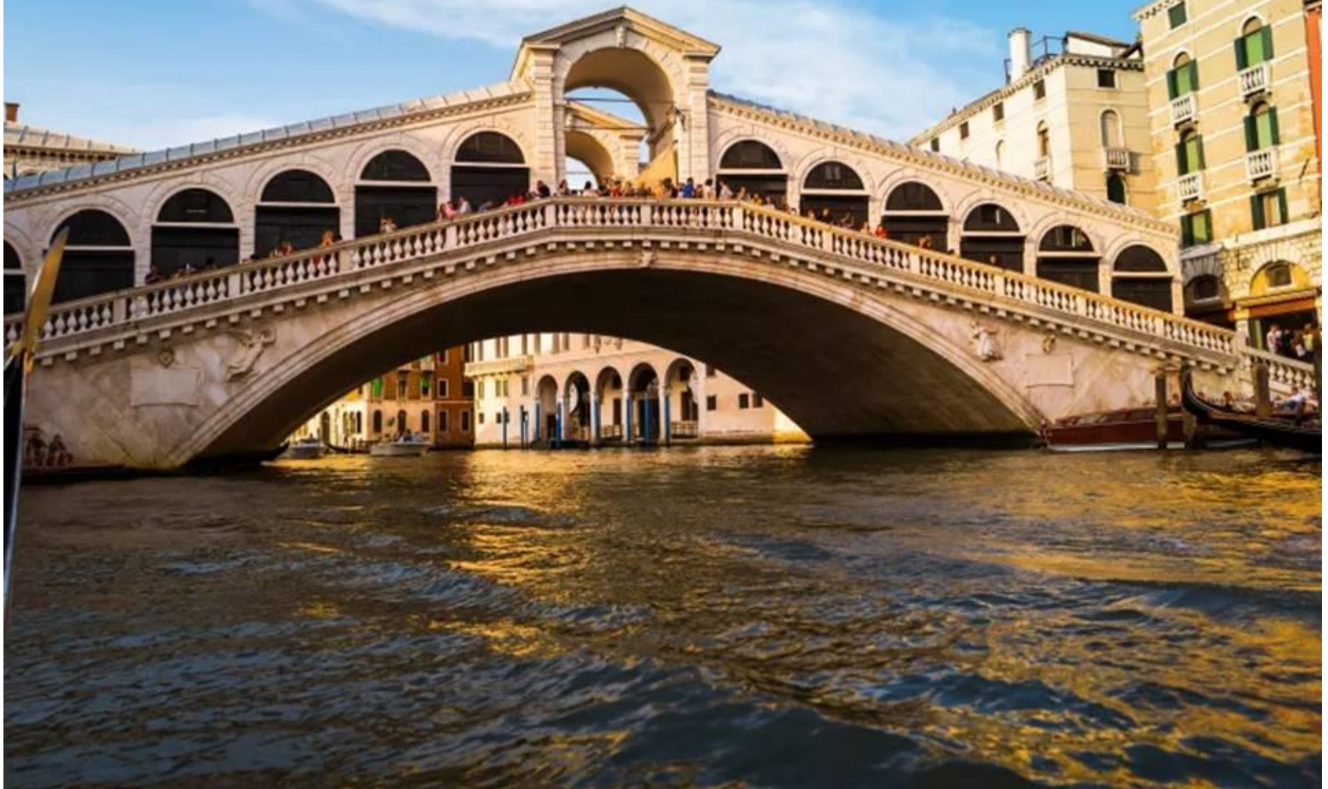
Pont du Rialto