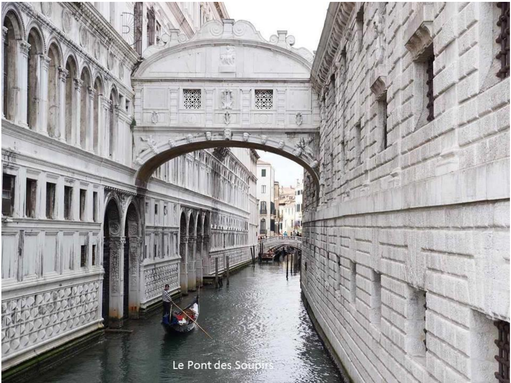
Le Pont des Soupirs