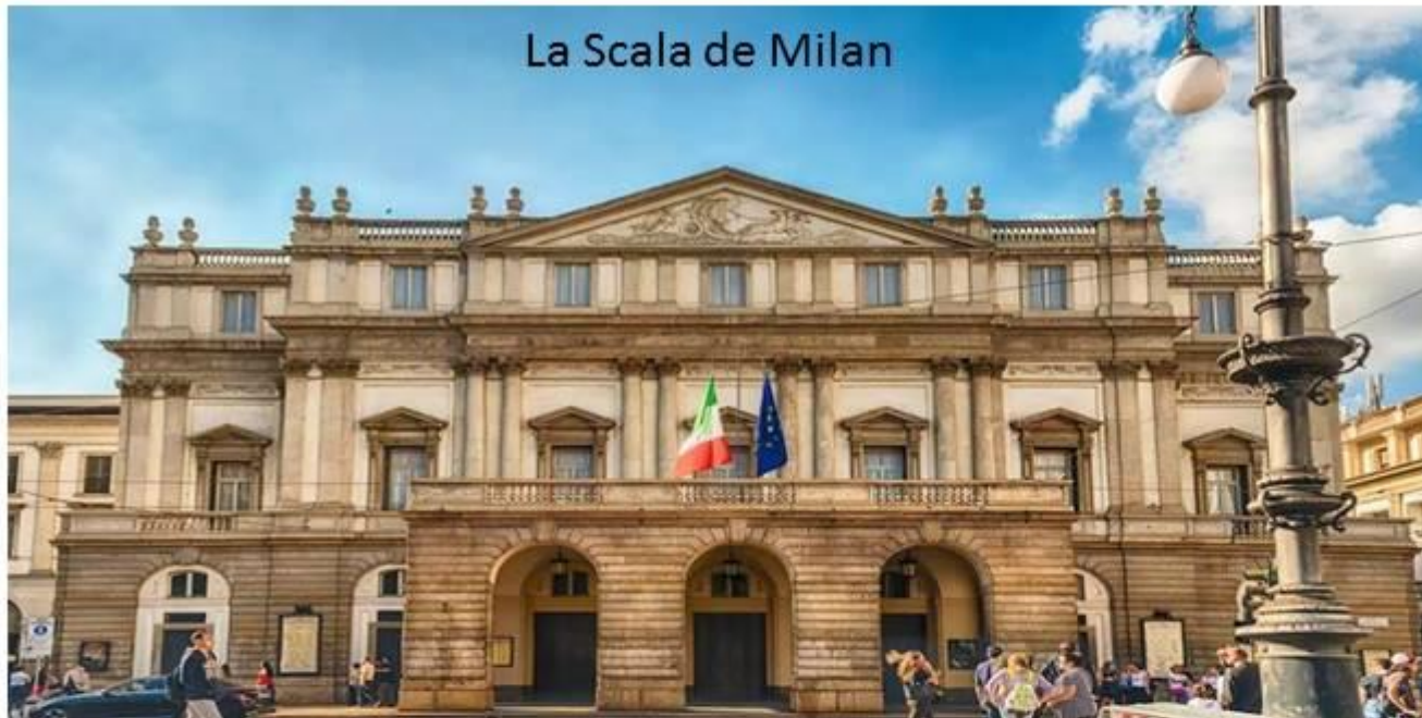
La Scala de Milan